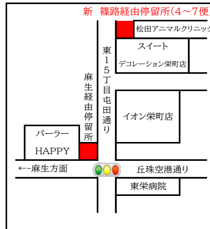
(栄町駅停留所) 1カ所変更になっております