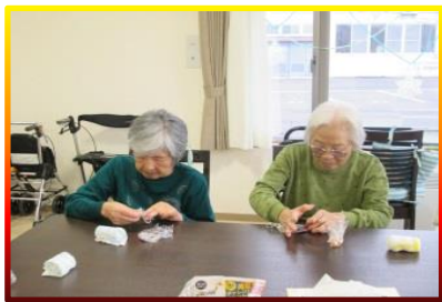
こねこねっ こねこねっ